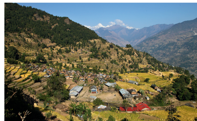
Dorf der befreundeten Familien in Nepal; Bild © Markus Borr

Bei einem Besuch 2015 hielt der passionierte Fotograf in Bildern die Schönheit und Sehenswürdigkeiten der Region Kathmandu fest, die nur wenige Wochen danach von einem heftigen Erdbeben erschüttert werden sollte. Das Dorf der befreundeten Familien, direkt im Epizentrum gelegen, wurde zu großen Teilen zerstört. Für den Wiederaufbau der Dorfschule und der Wasser-